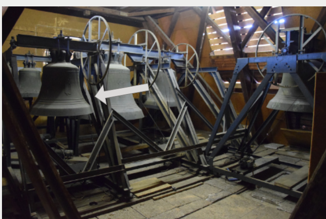
Glockenstuhl St. Michael, Bruder Klaus von Flüe Glocke zweite von links.

Gebet des Bruder Klaus: Mein Herr und mein Gott, nimm alles von mir, was mich hindert zu dir. Mein Herr und mein Gott, gib alles mir, was mich führet zu dir. Mein Herr und mein Gott, nimm mich mir und gib mich ganz zu eigen dir.